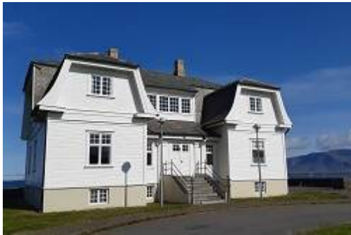
Villa Höfði (Reykjavik)

In dit advies , uitgekomen op 31 januari 2019, betoogt de AIV dat door de toename van het aantal kernwape­nstaten, de nucleaire moderniseringsprogramma's, de groeiende rol van China en de beschikbaarheid van nieuwe technologieën een nieuwe kernwapenwedloop dreigt. De nucleaire wapenbeheersingsverdragen en afschrikkingsconcepten uit de 20ste eeuw zijn ontoereikend en daarom pleit de AIV voor nieuw overleg tussen de kernwapenmogendheden.