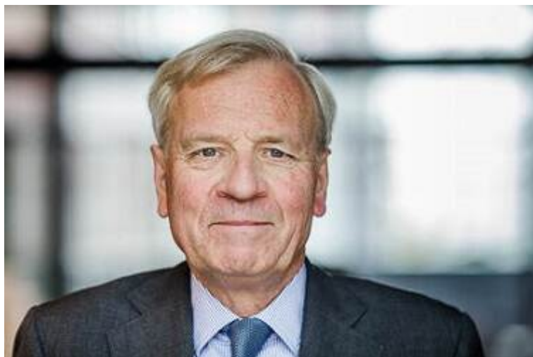
Prof. mr. Jaap de Hoop Scheffer, voorzitter

De AIV heeft er het afgelopen jaar veel werk van gemaakt om ruimere bekendheid te geven aan de AIV-adviezen en het functioneren van de raad. Op communicatiegebied zijn in 2019 verschillende vernieuwingen doorgevoerd. De AIV heeft een nieuwe huisstijl en een nieuwe website op webadres adviesraadinternationalevraagstukken.nl .