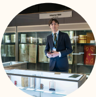
Floris Gast Antiquaar - Antiquariaat Forum